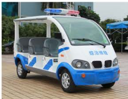
更多车身颜色 (可指定)