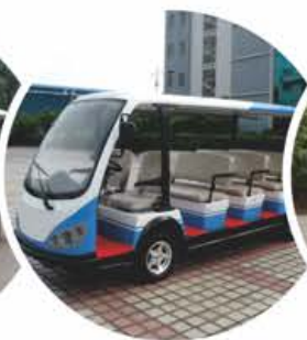
车身分色方案 (可指定颜色)