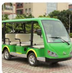
车身分色方案 (可指定颜色)