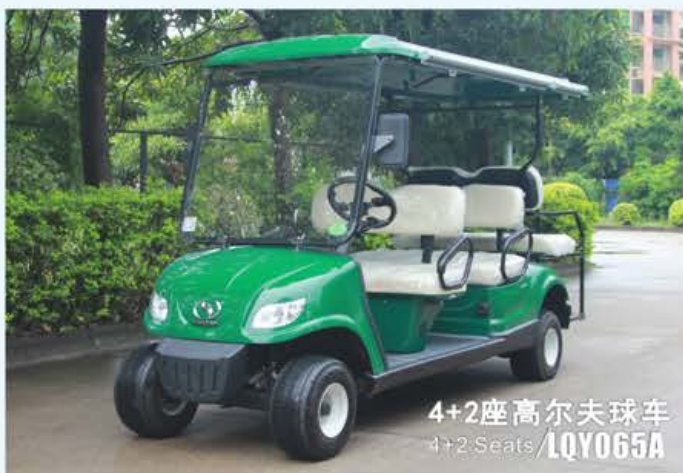
4+2座高尔夫球车 4+2.Seats / LQY065A