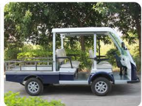
双排座半顶款(选配)