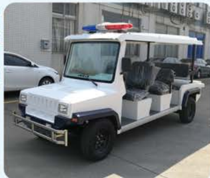
公安蓝白色款(可安装警灯)