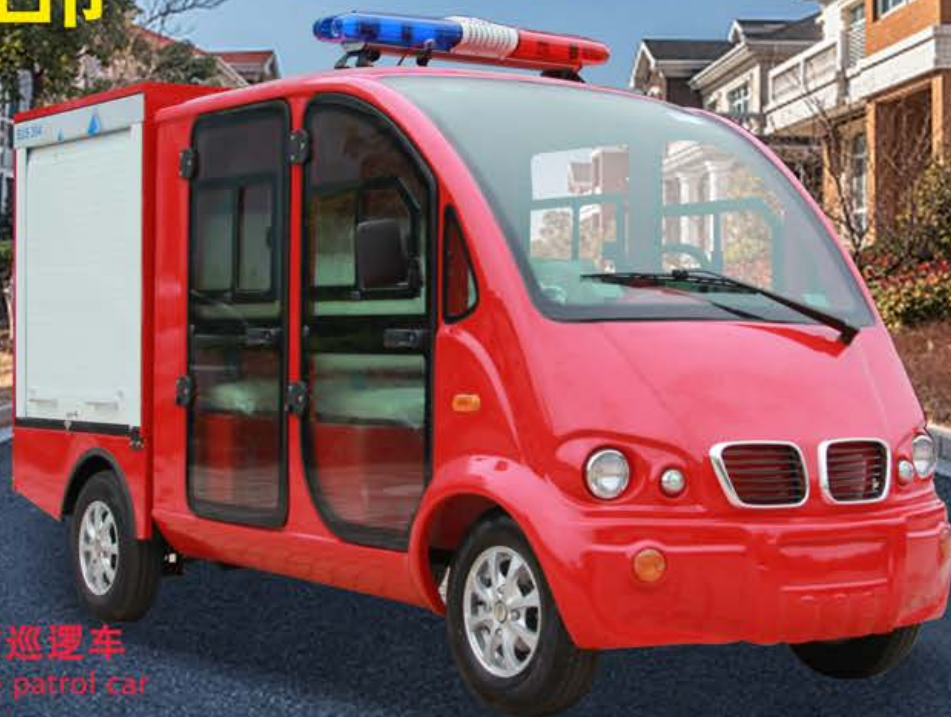
LQF051 电动消防巡逻车 Electric fire patrol car