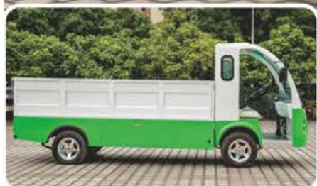
新型1.2吨不锈钢厢式电动货车/LQF122M