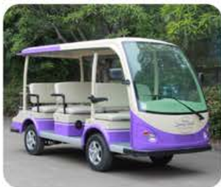
车身标准色 (丰田白)