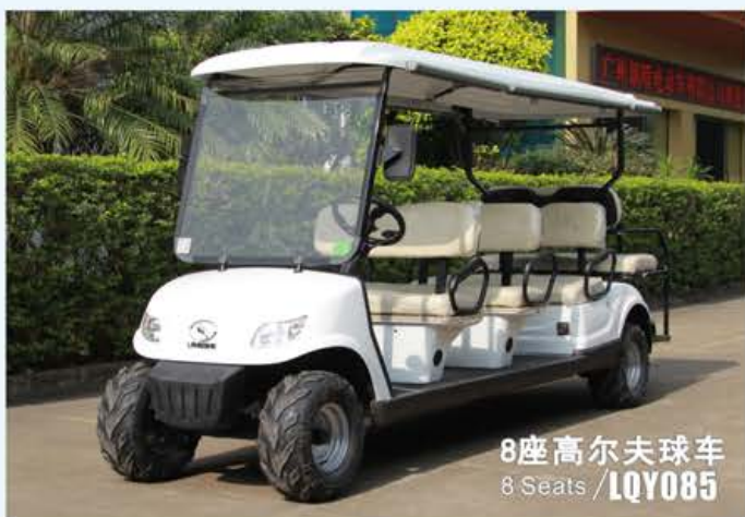
8座高尔夫球车 8 Seats / LQY085