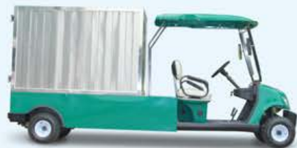
多功能车 | LQF065 Utility Car