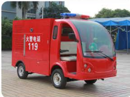
不带门消防车(标准款)