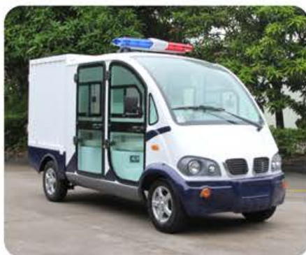
带门双排座箱式巡逻载货车