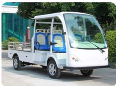
双排座公交座椅款