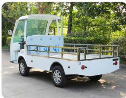
车身标准色(丰田白)