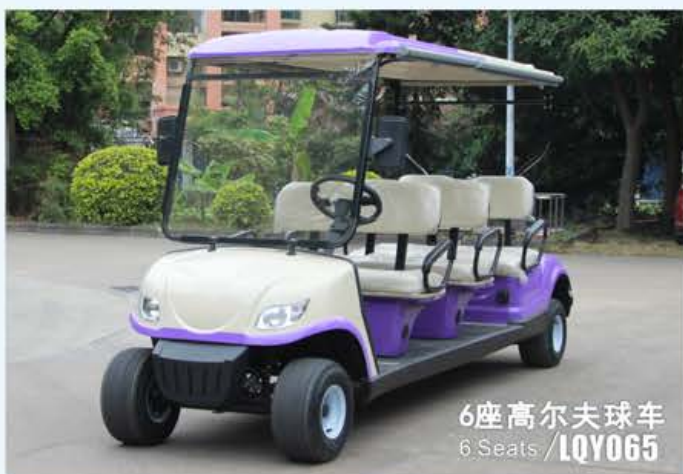
6座高尔夫球车 6 Seats / LQY065