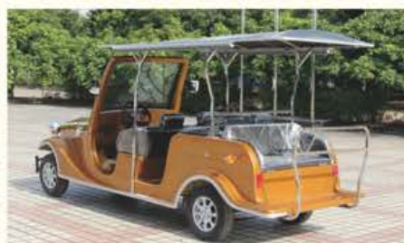
经典8座电动老爷车/LQL082