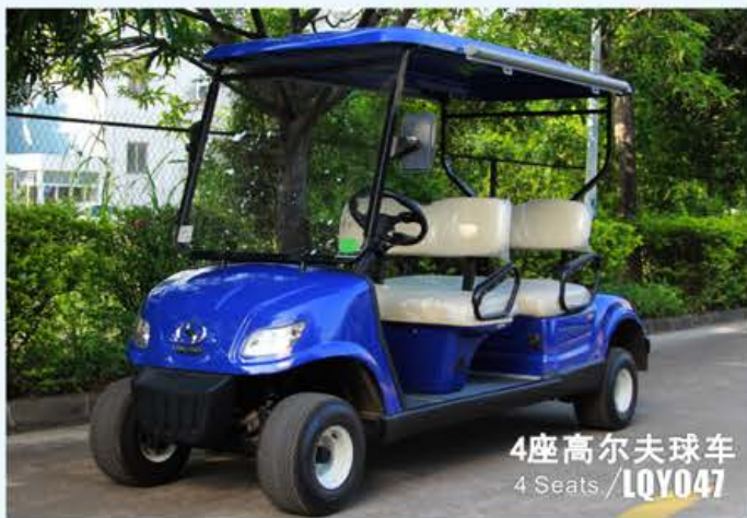
4座高尔夫球车 4 Seats / LQY047