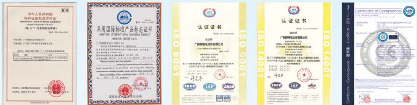
特种设备制造许可证 采用国际标准产品标志证书 质量管理体系认证 环境管理体系认证 欧洲CE认证