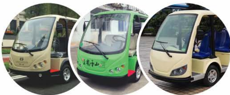
更多车身颜色 (可指定颜色)