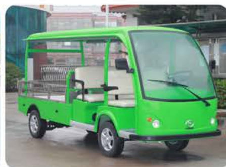
全顶双排座款 (定制)