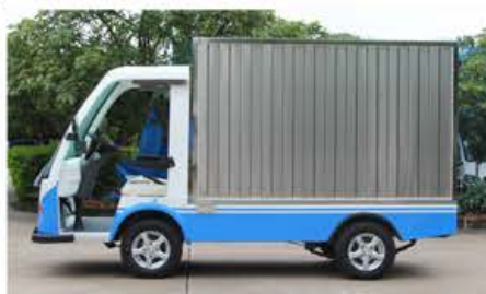
不锈钢货箱+更多车身颜色 (可指定)