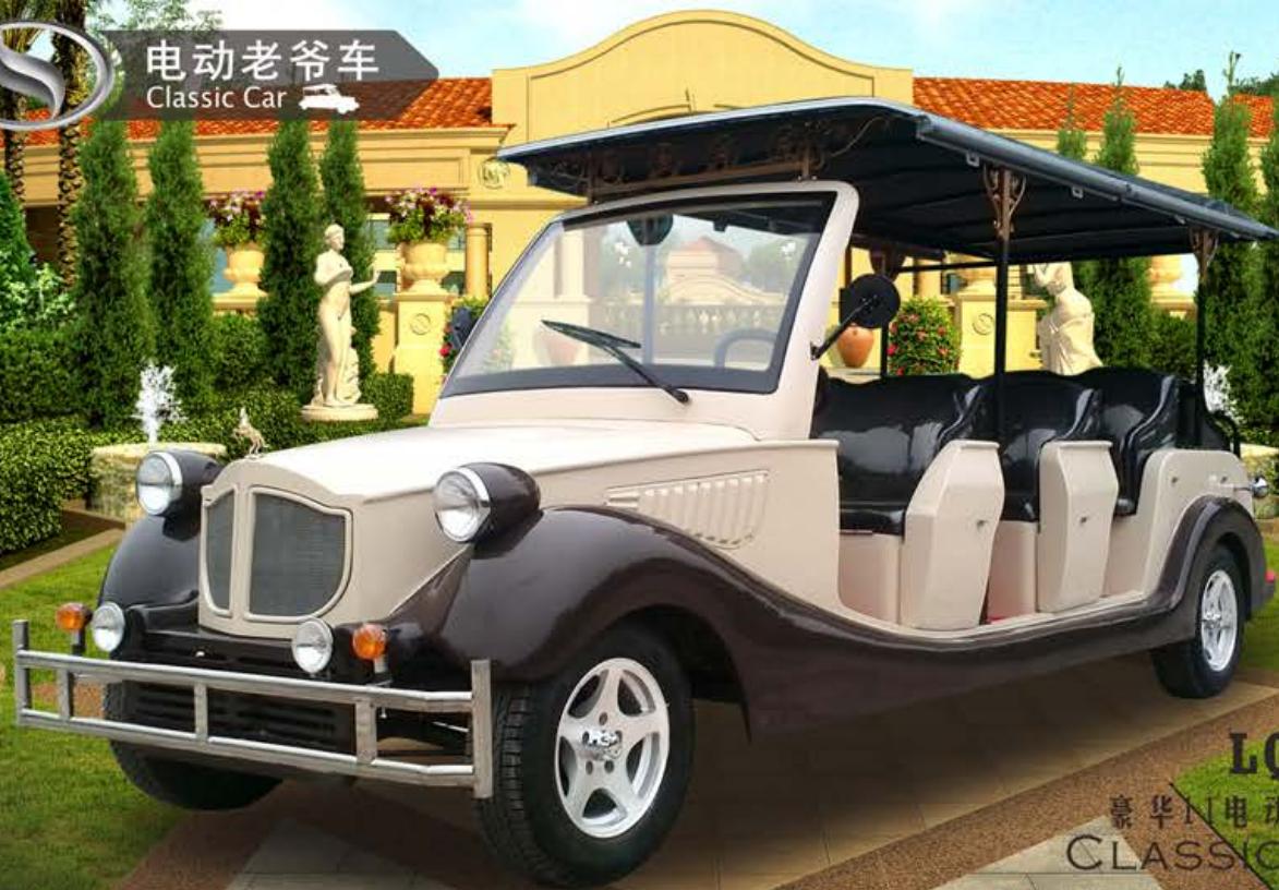
LQL111 豪华11座电动老爷车 CLASSIC CAR