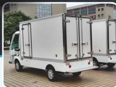
复合材料货箱+车尾后踏板 (定制)