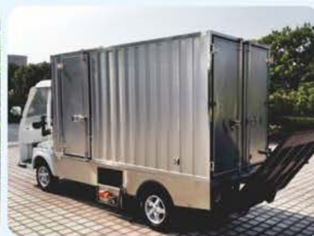
不锈钢货箱+升降尾板 (定制)