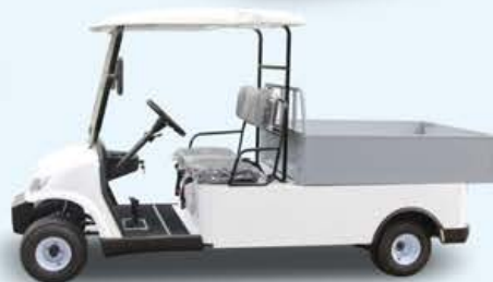
多功能车 | LQF047 Utility Car