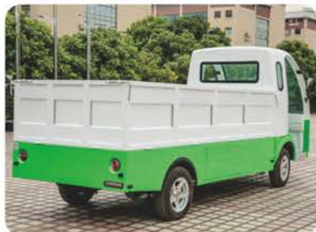
标准色：丰田白，订制：绿白