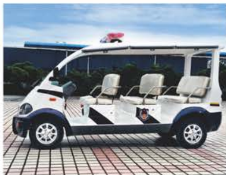
PU座椅+不锈钢扶手 (选配)