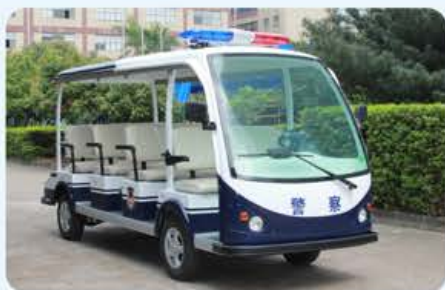
可安装警灯(车身分色方案)