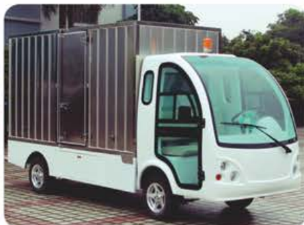
驾驶室封闭门+不锈钢货箱+侧开门+车尾后踏板（定制）