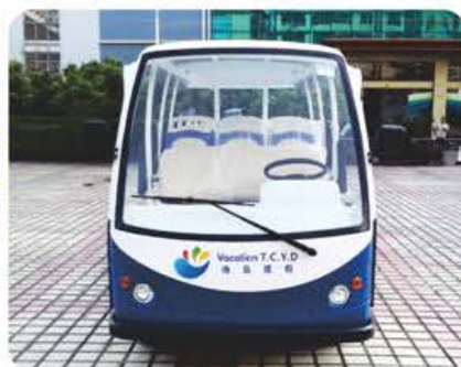
公交座椅 (选配), 前护杠 (选配)