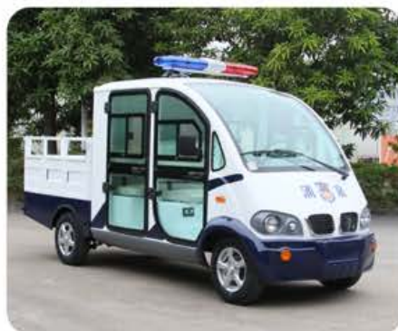
带门双排座巡逻载货车