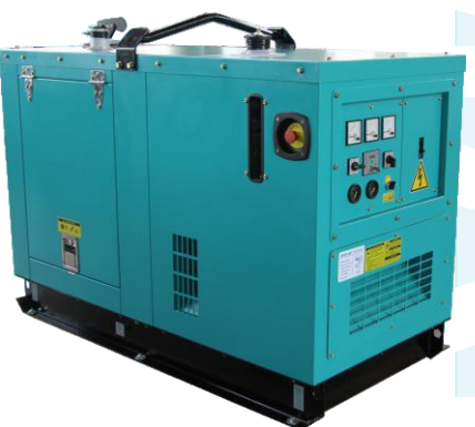
YMW-37T6 WITH CANOPY