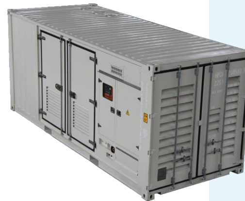
MSW-1050T5 WITH 20FT CANOPY