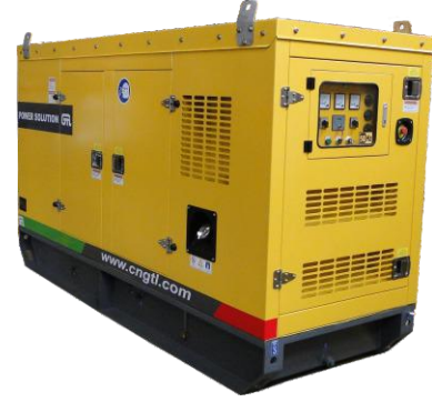
DCW-125T5 WITH CANOPY