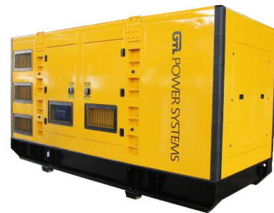
CCW-563T6 WITH CANOPY